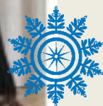
КОНКУРС МИСТЕР ТЕРЕМОК 2022