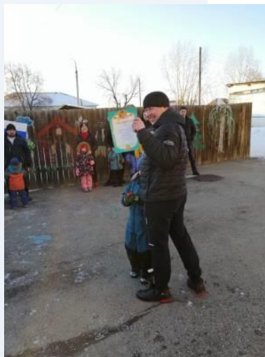
Папы и награждение!

которые стоят на страже нашей Родины. Это праздник настоящих мужчин — смелых и отважных, ловких и надёжных, а также праздник мальчиков, которые вырастут и станут защитниками Отечества. Это так же день памяти всех тех, кто не щадил себя ради Отечества, кто до конца оставался верен воинскому долгу.